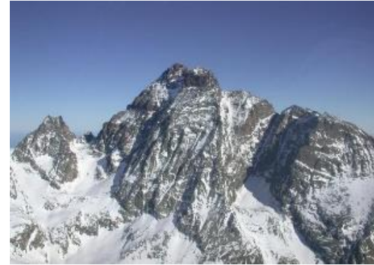
PNR du Queyras