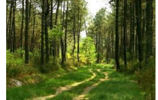
PNR des Landes de Gascogne