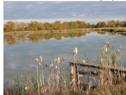
PNR de Brière