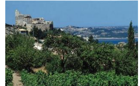
PNR de la Narbonnaise en méditerranée

20% de territorios de Parques clasificados Natura 2000