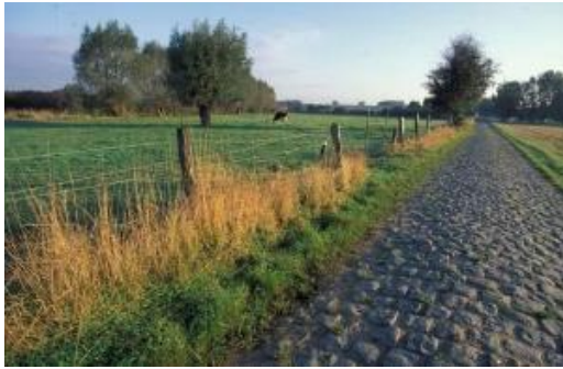
PNR Scarpe- Escaut

Alta y media montaña, llanuras, estuarios, humedales, bosques, sistemas costeros y ambientes marinos tropicales.