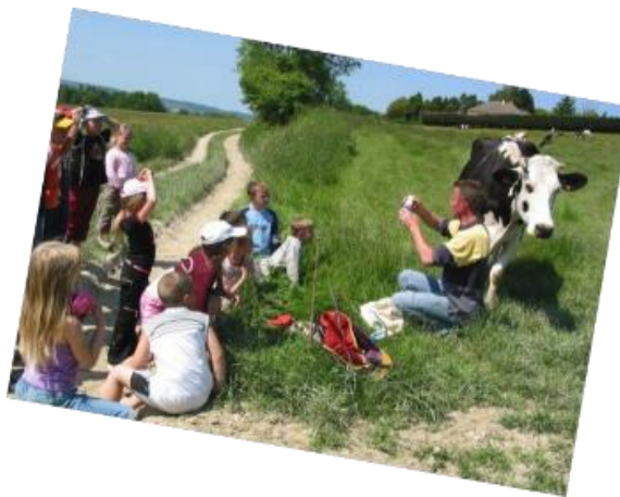
Ministerio del Medio Ambiente

Incluye todos los Parques Naturales Regionales, Regiones y Parques Nacionales Socios.