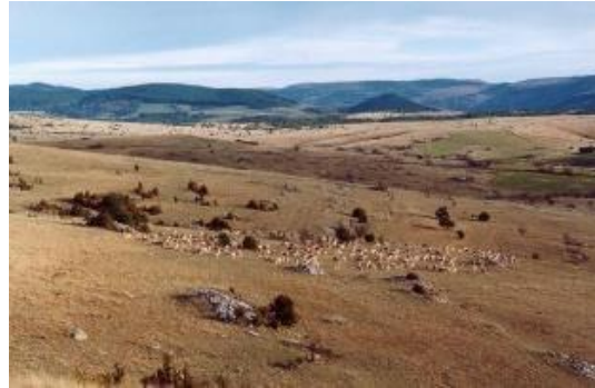
PNR des Grands Causses