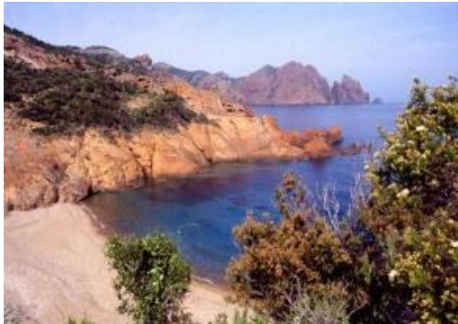
PNR de Corse